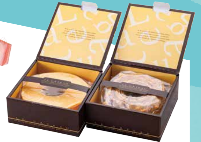
ソフトバウムクーヘン・ハードバウムクーヘン ハーブ900円/ホール1,800円