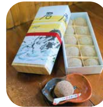
芥子餅(けしもち) 150円(1個)