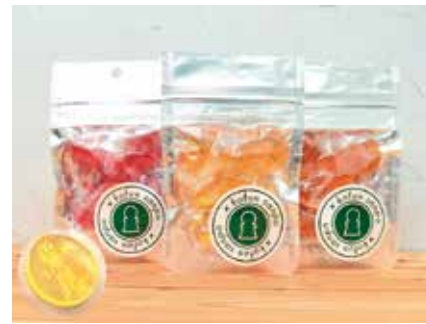
kofun sanpo ベっ甲(6粒入) 410円

堺市堺区南三国ヶ丘町4丁1-1 サンハイティ室谷102 [MAP:c] 定休日: 水曜・年末年始 営業時間: 9:00-17:00