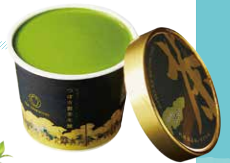
利休抹茶 あいすくりーむ(120ml) 380円 ※ギフトでのお取り扱いもごさいます。

堺市堺区九間町東1-1-2 [MAP:h] ☎072-227-7809 定休日: 火曜日、年末年始 ※火曜が祝祭日の場合は通常営業 営業時間: 10:30-18:00、 カフェ/11:00-L.O.17:30