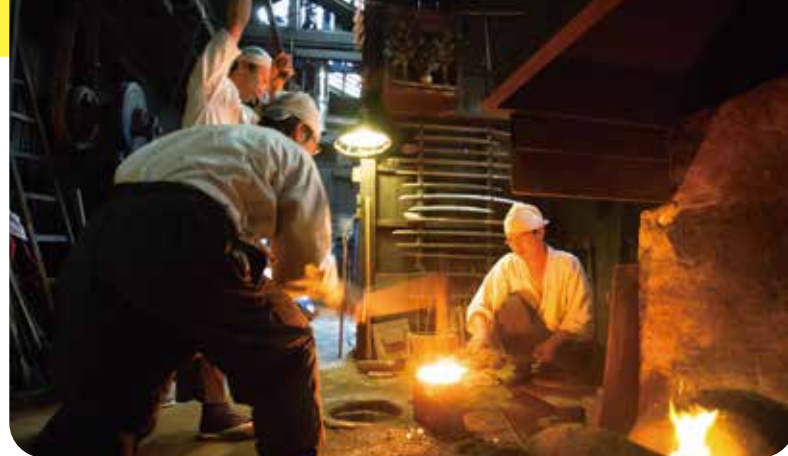
※堺文化財特別公開時の写真

MOVIE 映画「るろうに剣心 最終章 The Final/The Beginning」 The Final 2021年4月23日公開 The Beginning 2021年6月4日公開 配給ワーナー・ブラザーズ映画 監督/大友啓史 出演/佐藤健、武井咲、新田真劍佑 ほか ©和月伸宏/集英社 ©2020映画「るろうに剣心 最終章 The Final/The Beginning」製作委員会