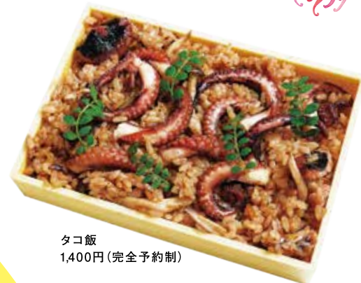
タコ飯 1,400円(完全予約制)

ぐる芽 堺市堺区車之町西1-2-15 [MAP:d] ☎072-228-8000 定休日: 火曜日(不定休あり) 営業時間: 17:30-22:30