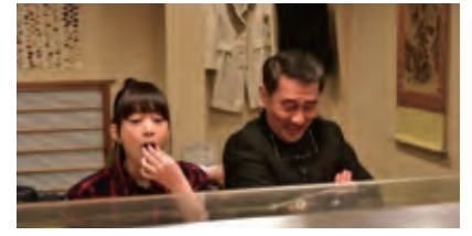
佐輔から利休の茶碗をだまし取れると決まった則夫がいまりと祝杯あげる寿司屋のシーンを撮影