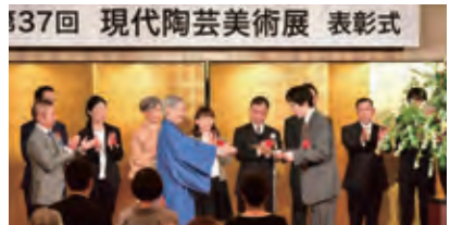
若かりし佐輔の作品が表彰された授賞式会場だけでなくチャペルやスカイラウンジなどいくつかのシーンを撮影

3 ホテル・アゴラ リージェンシー大阪堺 住所:堺区或島町 4-45-1 TEL:072-224-1121