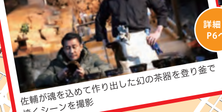
佐輔が魂を込めて作り出した幻の茶器を登り釜で焼くシーンを撮影

14 ハーベストの丘 住所:南区鉢ヶ峯寺2405-1 TEL:072-296-9911