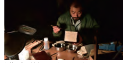
桐箱を作る材木屋の回想シーンを撮影

11 (有)堺美術オークション会 住所:美原区小平尾933 TEL:072-363-7333