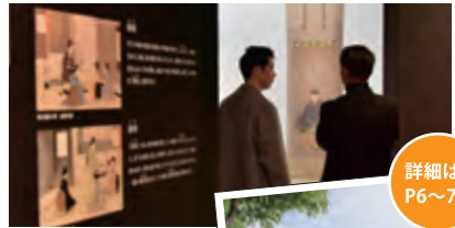
利休の和歌の解釈について則夫と佐輔が話をするシーンを撮影

5 さかい利晶の杜 住所:堺区宿院町西 2-1-1 TEL:072-260-4386